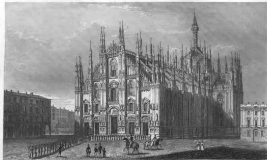
LES POLONAIS à MILAN.

Dowództwo nad Legionami powierzono gen. Janowi Henrykowi Dąbrowskiemu